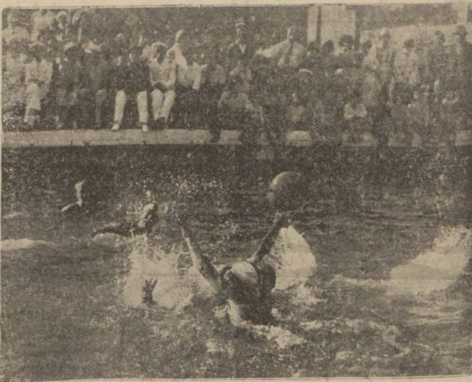
Dünkü müsabakalarda su topu oyunundan bir safha

Şehrimizde bulunan Amerikan darülfünunlularıyla Galatasaray ve Beylerbeyi yüzücüleri dün öğleden sonra Büyükdere'deki yüzme havuzunda muhtelif deniz müsabakaları yapmışlardır. Bu arada deniz topu müsakası da yapılmıştır.