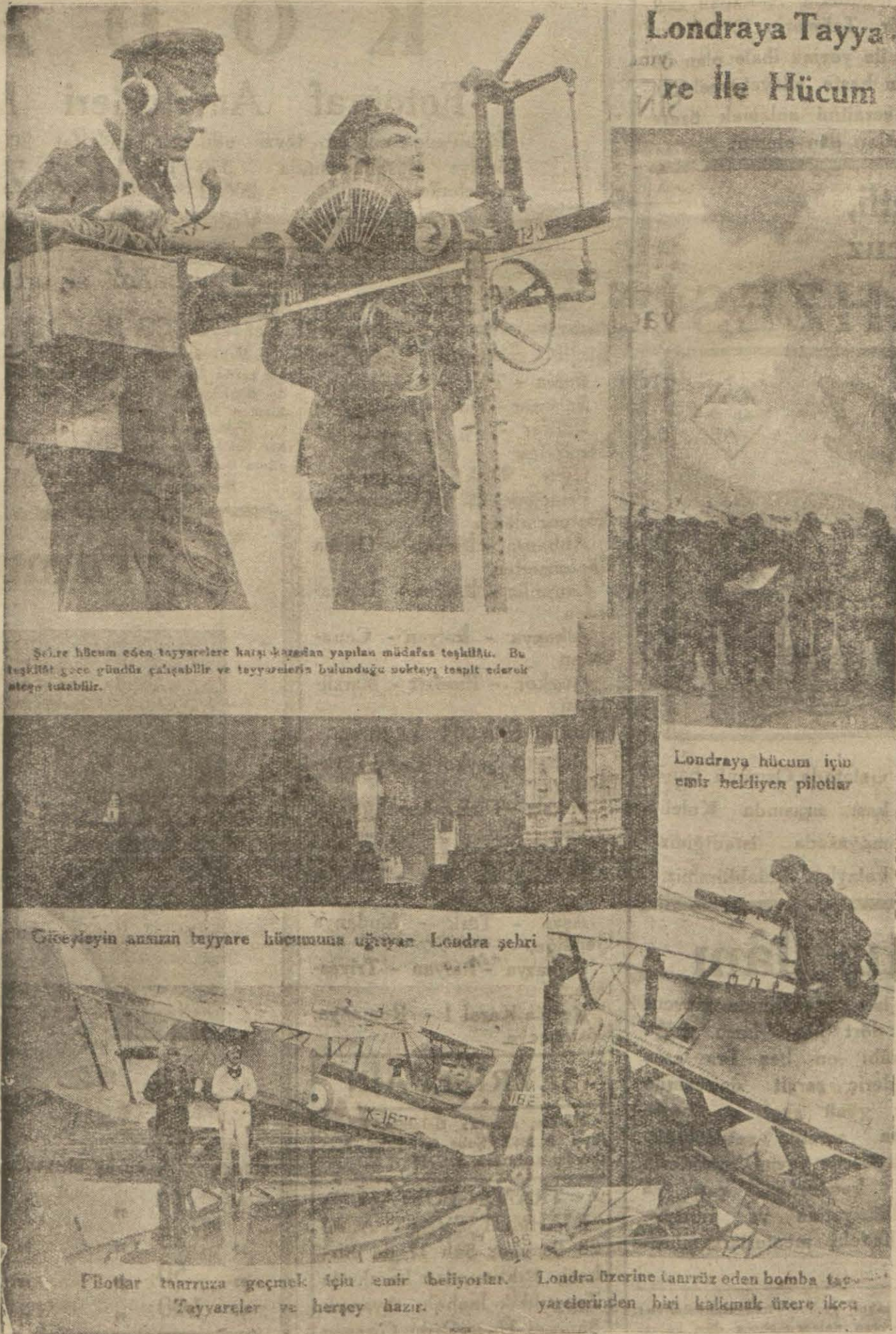
Selâle hücum eden tayyarelere karşı yapılan müdafaa teşkilâtı. Bu teşkilât 3000 gündüz çalışabilir ve tayyarelerin bulunduğu noktayı tespit ederek ateşe tutabilir.