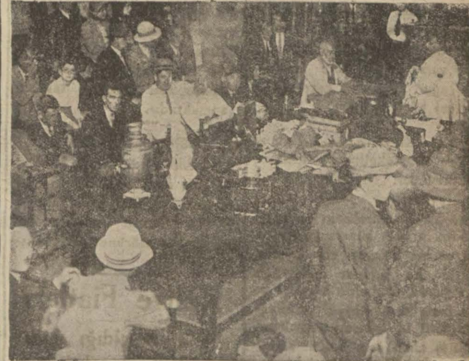
Sandal Bedesteninde bir müzayede

İktisadî buhran herkesin malûmu olan birşeydir. Bu buranın tesirile halk eşyasından ve mücevheratından bir kısmını satmak istiyor. Aldanmamak için de resmi bir zıman altında bulunan belediyenin Sandal bedesteninde bu işini yapmak istiyor. Alıcılar da yine aldanmamak için ihtiyaçlarını buradan temin ediyorlar. Mezat idaresi eşya, halı ve mücevherat kısımlarında dört tahminci bulundurmaktadır. Bunlardan en mühimmi olan mücevherat kısmında iki muhammin vardır. Söylenişine nazaran bunlardan birisi tellâlik-